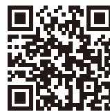
日本看護連盟公式 X (旧 Twitter)