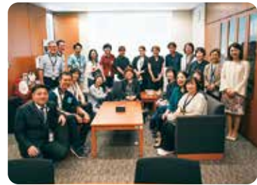
友納りお先生事務所