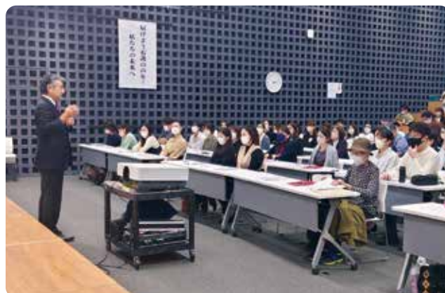
共催研修開催風景（2024年2月）