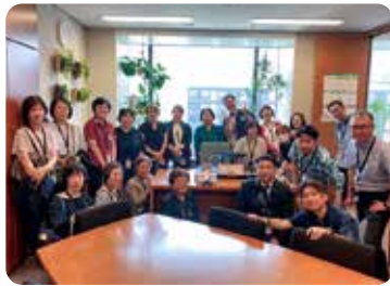
石田まさひろ先生事務所

国会見学： 2024年6月14日(金)は総会参加者21名で、参議院議員会館の友納りお先生、石田まさひろ先生事務所を訪問し、意見交換会等を行い有意義な時間になりました。