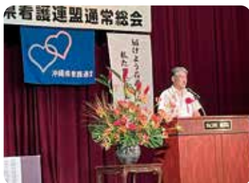
石田まさひろ参議院議員ご挨拶

審議内容 すべて承認頂きました。 第1号議案、2024年度 スローガン 第2号議案、2024年度 事業計画 第3号議案、2024年度 予算 第4号議案、選挙対策 第5号議案、役員選出