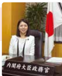
参議院議員 友納りお