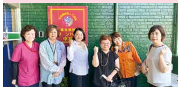
グリーンハウス中城

施設によっては施設内ラウンドも行い現状や 様々な課題について共有されました。 訪問の際にご協力ありがとうございました。