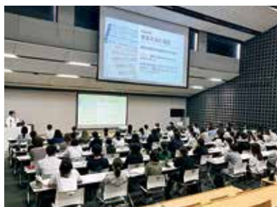
フレッシュマン研修