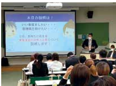
看護学校での説明会