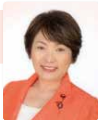
衆議院議員 あべ俊子

新年あけましておめでとうございます。今年も新しい年を迎えることができたこと、大変喜ばしく思います。