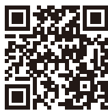
LINE ∞ [アンフィニ]