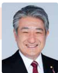
参議院議員 石田まさひろ

かつてないスピードで不確実性や複雑性を増す時代、みなさまの声を聴かせていただき、人材育成のための教育は国の基（もとい）と信じて、日々努力してまいります。看護は、命を慈しみ、大切な人を護るための知識と技術が学べる素晴らしい仕事であると、次世代に胸を張って伝えられるよう看護職の地位向上や環境改善に皆様と共に全力で取り組んで参ります。